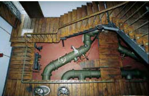
Im Innenraum des Wasserschlosses finden sich noch Originalteile aus der Bauzeit.

Das Gebäude aus den 1890er Jahren ist nicht nur ein Wasserhochbehälter. Mit ihm bringen die Freiburger Stadtherren sichtbar ihre Wertschätzung dem Trinkwasser gegenüber zum Ausdruck. Bei seinem Äußeren verwendeten die Architekten große Sorgfalt darauf, dem funktionellen Bauwerk mit vornehmen und kostbaren Einzelheiten eine besonders wertvolle Anmutung zu geben.